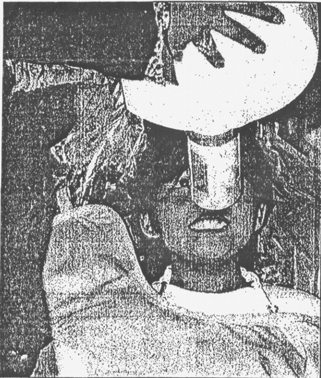
Una de las niñas de Miller Elementary School al momento de tomarle una toma de las radiografías de su dentadura.

Para mayor información llamar al Distrito Escolar de Alum Rock al (408) 928-6590. O a Félix Álvarez al Family Resource Center (408) 254-5985.