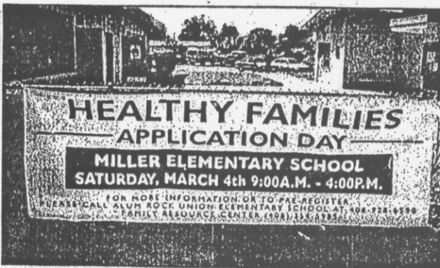
En la gráfica se aprecia una maleta de Healthy Families con la información correspondiente anunciando el Día de Asistencia para Solicitar por Healthy Families en Miller Elementary School en San José. (Foto por Frank Andrade).